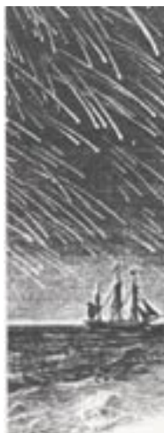
Fig. 1 - Antica stampa che raffigura uno sciame di meteore.