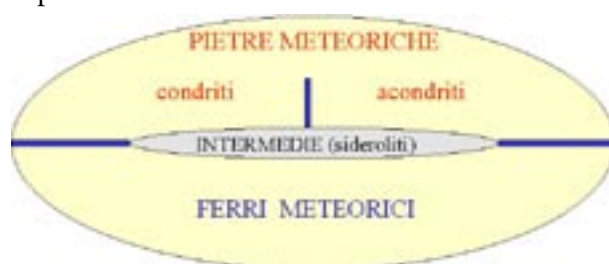
Fig 2 - Schema della composizione delle meteoriti.

Si parla sempre di meteoriti al plurale e, in effetti, questi materiali possono essere abbastanza diversi fra loro, anche come aspetto, come è schematizzato dalla figura 2 che riassume i vari tipi di meteoriti.