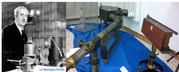
Figura 1. A sinistra, fotografia di Camillo Porlezza; a destra, fotografia di uno spettrometro appartenuto a Camillo Porlezza esposto durante una mostra didattica presso il Museo di Storia Naturale di Rosignano Solvay (ottobre 2011) [2]

A questo proposito, durante le lezioni porto spesso con me alcuni oggetti, come alcune parti di spettroscopi (si veda Figura 1) di proprietà del Dipartimento di Chimica e Chimica Industriale dell'Università di Pisa, che appartennero ai chimico-fisici Camillo Porlezza (1884-1972) e Raffaele Nasini (1854-1931) della "Scuola Pisana". [2,3]