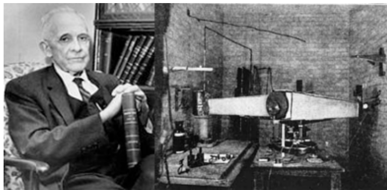
Figura 3. A sinistra, William Coblentz; a destra, uno dei primi spettroscopi infrarossi costruiti dallo stesso Coblentz. [4]

ni legami. Infatti, l'assorbimento dei fotoni infrarossi corrisponde ad una transizione energetica tra livelli vibrazionali della molecola.