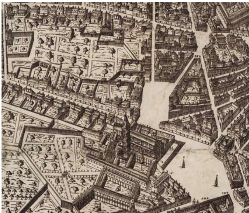
Figura 18: Stefano Bonsignori, Pianta di Firenze, 1594, particolare del lato nord di piazza Vecchia di S.Maria Novella e del tratto iniziale di via Gualfonda o Valfonda. Collocazione: Firenze, Palazzo Vecchio, Tracce di Firenze.

distante infatti, in fondo a via Gualfonda, Chiappino Vitelli, anch'egli umbro, legato ai Baglioni e ai Della Cornia da rapporti di parentela e di attività militare, ha acquistato dai Bartolini un casino dotato di ampi orti e giardini.