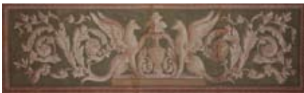
Figure 29-30-31: Specchiature geometriche con motivi decorativi classicheggianti