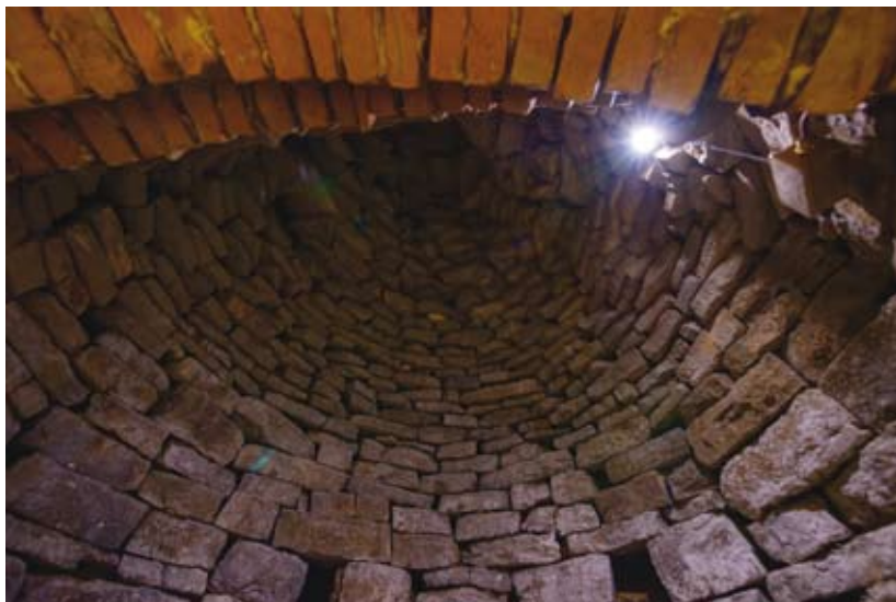
Figura 6: L'interno della falsa cupola a ogiva

di circa 190 cm. Le pareti sono quasi verticali nella parte più bassa, realizzata in blocchi di pietra tagliata con cura e posati a secco senza malta; da questa parete si diparte un progressivo restringimento del diametro ottenuto con la tecnica della “falsa cupola”, ovvero col ricorso a lastre piuttosto spesse, ancora di pietra e poste a secco, disposte a sporgere verso l'interno su anelli sempre più stretti, che formano una cupola a ogiva chiusa in alto da pietre piatte (figura 6). Le ceramiche nello strato di fanghiglia che riempiva ancora il fondo interno al momento della scoperta attestano un utilizzo della struttura sino ai secoli XIV e XV.