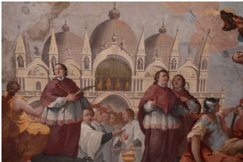
Figura 41: Lato corto a sinistra della porta d'ingresso: veduta della basilica di San Marco

24 luglio 1177, tra Papa Alessandro III, della famiglia senese dei Cerretani Bandinelli, con il quale i Cerretani fiorentini vantavano una parentela, e l'imperatore Federico Barbarossa. L'incontro fu di grande importanza storica per il raggiungimento di un accordo politico nel conflitto tra l'imperatore e i comuni italiani, riportando la pace e la concordia anche tra la Chiesa e l'Impero. La decorazione dunque vuole enfatizzare la nobile antichità della famiglia e la sua importanza storica e politica anche per lo stabilirsi di buoni rapporti tra religione e potere laico.