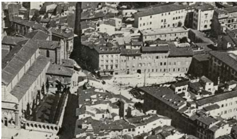
Figura 22: fotografia dell'area, ca. 1934 (particolare).

erge al centro l'obelisco disegnato da Giovanni Pini, in ricordo dei caduti nelle guerre d'Indipendenza e negli anni successivi più volte si ridisegna lo spazio centrale che lo ospita (figura 22).