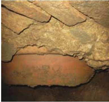
Figura 15: L'orcio di raccolta per i liquami ancora inserito nel suolo dello scantinato. Foto da scavo

industriale degli anni a cavallo tra Ottocento e Novecento, testimoniando così con precisione la data di demolizione dell'apparato nello scantinato, del bagno e del salottino soprastanti.