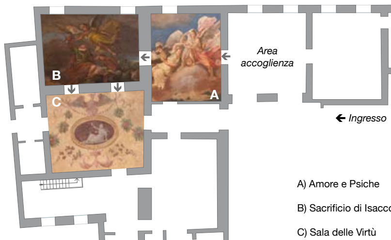
Figura 23: Mappa di parte della biblioteca

Nei locali che sono ora sede della Biblioteca della Toscana Pietro Leopoldo tre sale sono arricchite da interessanti decorazioni pittoriche.