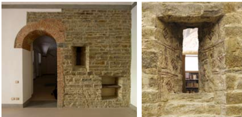
Figure 7-8: La sala oggi in uso alla Biblioteca della Toscana prima degli interventi archeologici, con il muro interno della turris e un dettaglio dell'interno della feritoia

La turris corrisponde all'incirca al vano del piano terreno della biblioteca; sul lato orientale sono state mantenute a vista le murature in pietra, nelle quali si apre l'interno della feritoia che si restringe verso l'esterno (figure 7, 8).