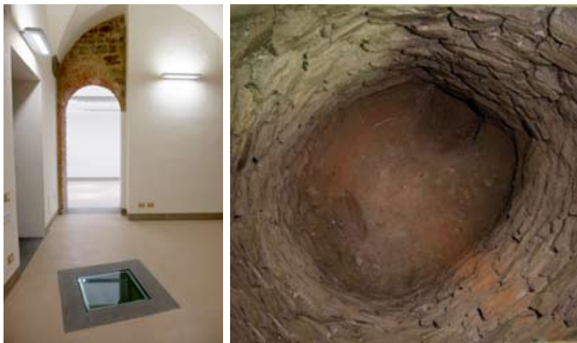
Figure 13-14: Scoperta del pozzo all'interno del loggiato; il pozzo è attualmente visibile nel pavimento della biblioteca

della loggia lo spazio da essa coperto viene riorganizzato, realizzandovi il pozzo mantenuto in vista (figure 13, 14). In seguito viene realizzata una ulteriore cantina accessibile dalla loggia con una pavimentazione in lastre di pietra, corrispondente a parte dello scantinato dove è attualmente visibile il fondo del lacus di età romana; per accedervi viene creato sotto il loggiato un primo vano scala sul versante a ridosso della turris , oggi non più visibile, coperto da una volta a botte. E' proprio a causa della realizzazione di questo scantinato che il calcatorium romano venne quasi totalmente distrutto, intaccando tutti quegli strati archeologici che sino ad allora si erano conservati: ne offre una testimonianza il ritrovamento di ceramica romana del I secolo a.C. - I secolo d.C. nel riempimento che venne sparso sul pavimento della loggia per rialzarne la quota, utilizzando proprio la terra estratta dallo scavo della cantina.