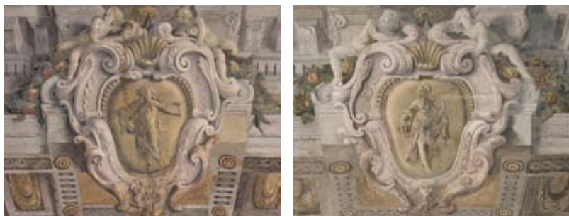
Figure 38-39: L'Allegrezza e la Temperanza

Sopra le logge dipinte che sembrano sfondare le pareti si notano due scudi a cartocci. In quello a destra è raffigurata l'Allegrezza, una ragazza che tiene in mano dei fiori e un vaso di cristallo (figura 38). A sinistra è raffigurata la Temperanza, una donna che tiene in mano un freno e un orologio (figura 39).