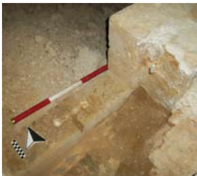
Figura 9: Particolare del cardine in ferro conservato. Foto da scavo

(figura 9). La forma del passaggio era stata studiata in modo tale che il battente ligneo del portone potesse aprirsi verso l'interno ma, una volta chiuso, i suoi margini laterali ed inferiore rimanessero protetti dagli sganci in pietra e non potessero essere scalzati da eventuali assalitori. L'interno della torre era rialzato rispetto all'esterno e pavimentato in lastroni di pietra. Dalla porta si