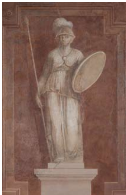
Figura 32: Statua di Athena-Minerva

Sulla parete con finestre, tra due specchiature con motivi vegetali, è raffigurata una statua femminile su un piedistallo contro un fondo rosso (figura 32). La presenza di lancia, scudo ed elmo la identificano come Athena - Minerva, dea della Sapienza. La raffigurazione deriva dalla Minerva di Arezzo, statua in bronzo del III sec. a.C., oggi al Museo Archeologico Nazionale di Firenze, alla quale il braccio destro di restauro piegato a sorreggere una lancia fu rimosso nel 1783 e sostituito nel 1785 da un nuovo braccio teso in avanti. Non ne deriva una datazione certa, infatti il pittore potrebbe avere fatto riferimento, anche dopo il 1783-1785, ad una precedente