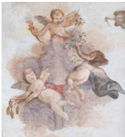
Figura 33: Composizione allegorica

a destra la Giustizia con la bilancia, verso il fondo la Temperanza con le redini, dalla parte opposta la Prudenza con lo specchio. Al centro del soffitto una composizione allegorica con tre amorini che volano; quello più in alto tiene in una mano una fiaccola e nell'altra una rosa gialla; quello a destra tiene delle rose rosse, quello a sinistra delle capsule di papavero (figura 33). Dalla cornice si affaccia un uccello (cicogna o fenice) che tiene tra le zampe un fiore blu. Il significato dell'allegoria non è ancora chiaro.