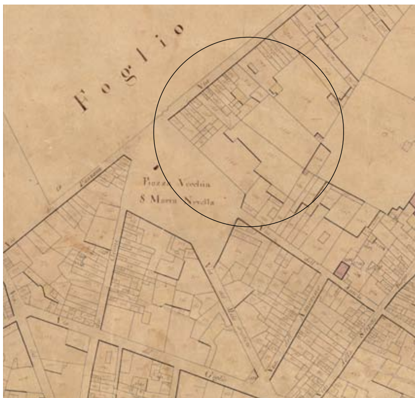
Figura 19: Archivio di Stato di Firenze, particolare dalla mappa del Catasto Generale Toscano, Foglio 1, Sez. 3, Firenze (ASFi, CGT, mappe, 1834-36). Vietata la riproduzione o la duplicazione con qualsiasi mezzo

Il progressivo accrescimento del patrimonio è frutto di una secolare, oculata amministrazione, di spese di rappresentanza contenute nella giusta misura e di una scarsa prolificità, la quale evita la dispersione del patrimonio ma nel contempo porta all'esito finale dell'estinzione della famiglia.