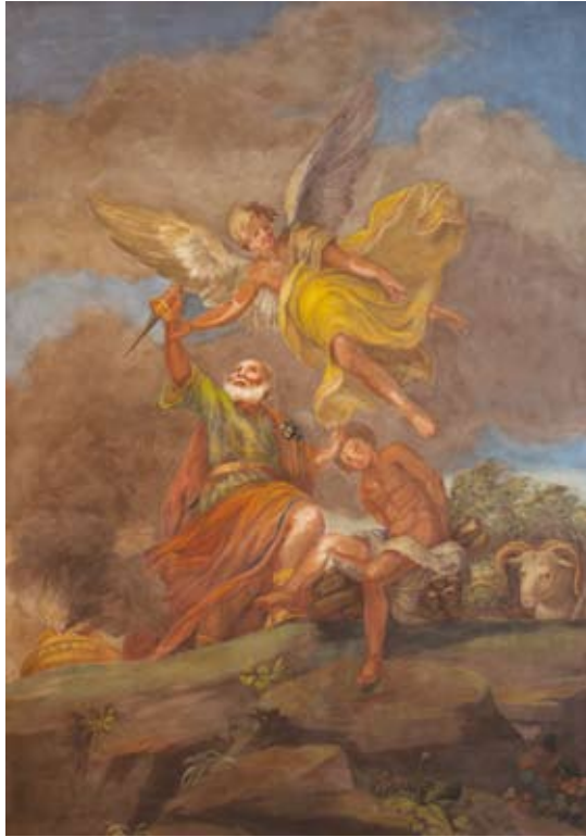
Figura 28: Sacrificio di Isacco

Anche in questa stanza la decorazione parietale è più antica e stilisticamente riferibile al periodo neoclassico di fine Settecento - inizio Ottocento.