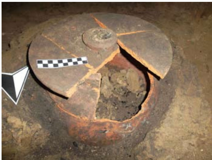
Figura 12: Il recupero dell'orcio "a beccaccia" trecentesco. Foto da scavo

La presenza dell'abbaino indica come questo si affacciasse su uno spazio ancora scoperto antistante la torre verso nord, e come dunque tutti i corpi di fabbrica inglobati oggi nella parte posteriore del palazzo ancora non esistessero.