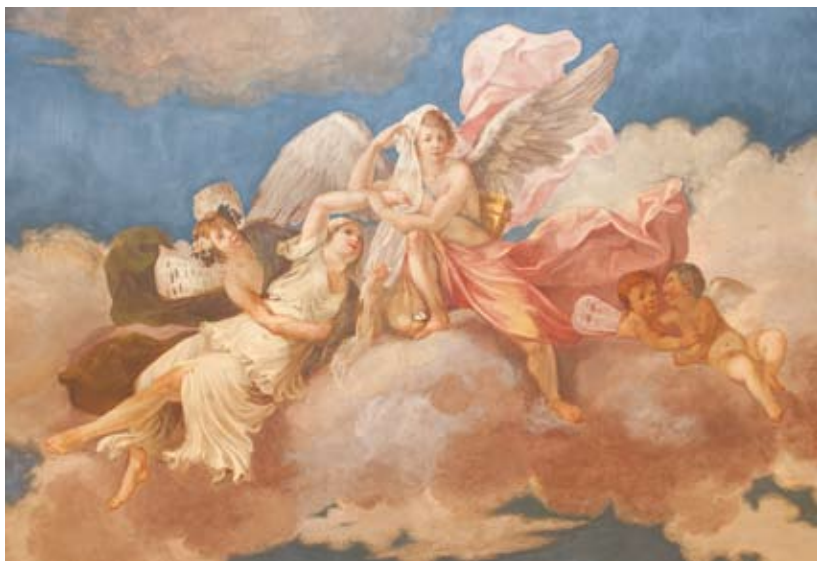
Figura 24: Amore e Psiche

spunta dietro la schiena. Psiche è raffigurata più in basso a sinistra, mentre ascende all'Olimpo verso Amore; è vestita di bianco e con le mani sembra portare via il velo posto sul capo del Dio, forse come allusione al desiderio di svelare l'aspetto del suo misterioso marito e quindi, in senso metaforico, al desiderio dell'anima di conoscere Dio. Nella sua ascesa, Psiche è sorretta da un cupido con il mantello verde e i capelli inghirlandati, che la abbraccia. Sotto lo svolazzante mantello rosa del dio Amore spuntano tra le nuvole due amorini abbracciati: uno ha il volto di bambina con capelli biondo-rossastri, l'altro ha volto maschile con capelli scuri. Si può notare che sia le ali del cupido che sorregge Psiche, sia quelle del cupido bambina sono ali di farfalla; quelle del Dio e del cupido con volto maschile sono invece ali di uccello.