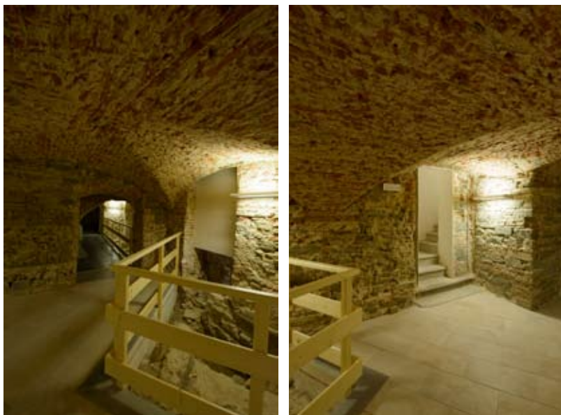
Figure 1-2: Le sale al piano interrato dopo l'allestimento per le visite creato in base ai risultati delle indagini archeologiche

In età etrusca un primo nucleo abitato si formò proprio nei pressi di un guado sull'Arno posto all'incirca in corrispondenza dell'attuale Ponte Vecchio, su un dosso che ancora oggi caratterizza lo spazio del centro fiorentino, tra piazza del Duomo, piazza della Repubblica e via del Proconsolo.