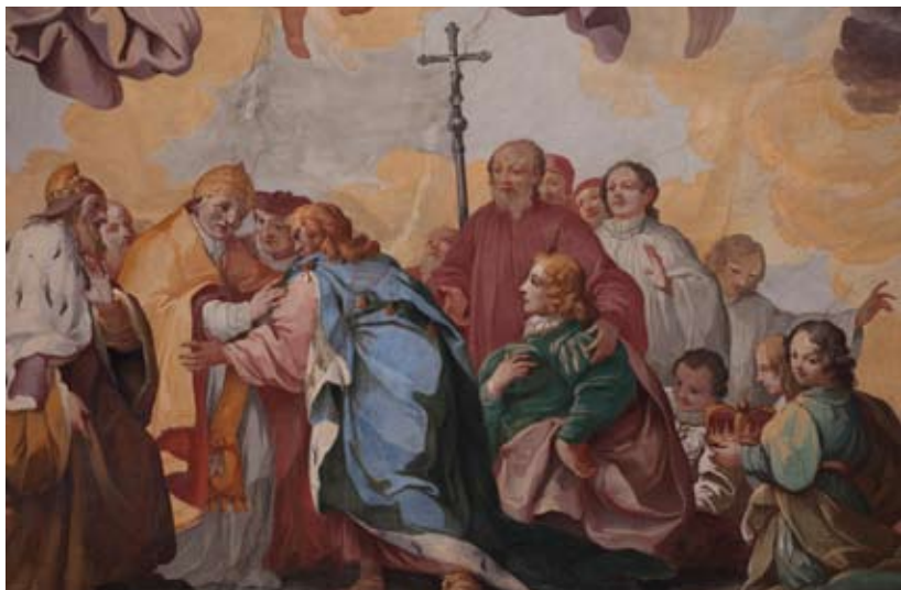
Figura 40: Lato di fronte alla porta di ingresso: incontro tra il Papa e l'imperatore

Sala Barbarossa. Si tratta di una galleria, ornata da stucchi, specchiature e nicchie per statue e busti, fu realizzata dopo l'incendio del 1714, che aveva rovinato in particolare la parte ovest del palazzo verso via Valfonda. Come in tutte le residenze aristocratiche di epoca barocca, la galleria aveva la funzione di ospitare e mostrare le preziosità di famiglia: statue antiche, pitture, medaglie, monete, armi e così via. I lavori furono eseguiti tra il marzo 1722 e il maggio 1728 a spese dal canonico Agostino, uno dei tre fratelli Cerretani che allora vivevano nel palazzo. Il progetto fu affidato all'architetto Alessandro Galilei (Firenze 1691-Roma 1737), che in questi anni era ritornato in patria dopo un soggiorno in Inghilterra e rivestiva la carica di "ingegnere delle fortezze e fabbriche del Serenissimo G.D. di Toscana", prima di trasferirsi a Roma al servizio di papa Clemente XII. Successivamente, la galleria fu completata con la decorazione ad affresco della volta. La scritta sorretta da due angioletti ricorda l'anno di esecuzione delle pitture, il 1743; il loro autore, Vincenzo Meucci; il committente, il canonico Agostino Cerretani; e il tema iconografico.