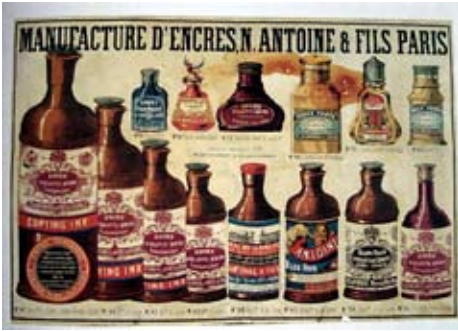
Figure 16-17: Alcuni frammenti ritrovati e l'etichetta che li attribuisce alla produzione di N. Antoine