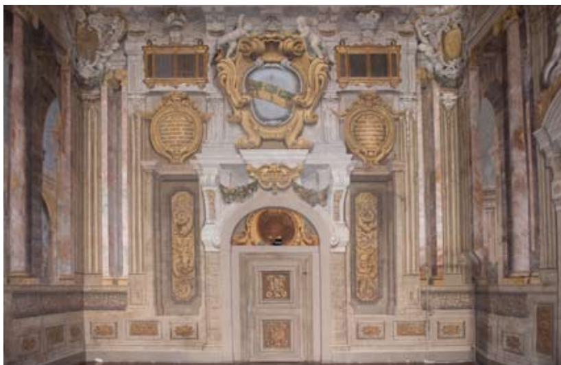
Figura 34: Parete di fondo ornata da architetture dipinte con fasto barocco

La parete di fondo del salone è ornata da architetture dipinte con fasto barocco. Alla sommità un cornicione sorretto da mensole sembra proiettarsi in avanti nello spazio. Elaborate cornici di colore bianco marmoreo inquadrano, in alto, le finestre di affaccio dal piano superiore. La porta dipinta è sovrastata da un timpano sporgente su mensole sopra il quale campeggia, come appeso a un anello pendente dal cornicione sommitale, un grande scudo a cartocci con lo stemma dei Cerretani: fondo azzurro con banda d'oro caricata di tre alberi di cerro sradicati (figura 34).