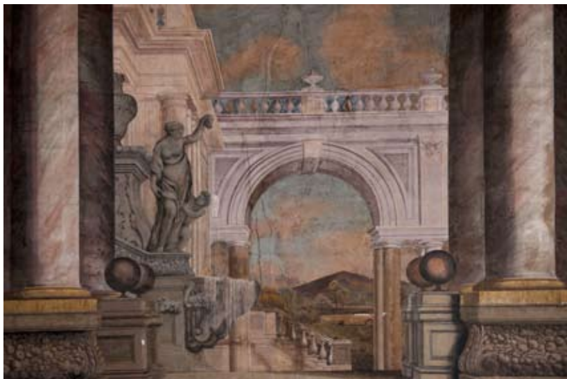
Figura 37: Parete destra della sala dei convivi

apre su una scalinata che conduce verso un edificio colonnato, di fronte al quale si vede il muro di un palazzo classicheggiante con un portico sovrastato da un terrazzo con balaustra; attraverso l'arco si scorge la campagna o un giardino. Forse questo portico dipinto si ispirava alla loggia del palazzo Cerretani aperta sul giardino retrostante.