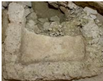
Figura 5: Il fondo del lacus nelle sue attuali condizioni

Del calcatorium rimane parte della pavimentazione, realizzata in calcestrutto su un letto di ciottoli fluviali, visibile in sezione lungo una parete dello scantinato. La pendenza permetteva il deflusso dei liquidi verso la vasca rettangolare di raccolta, il lacus , che era rivestita in cocchiopesto e da lastre di terracotta (figura 5).