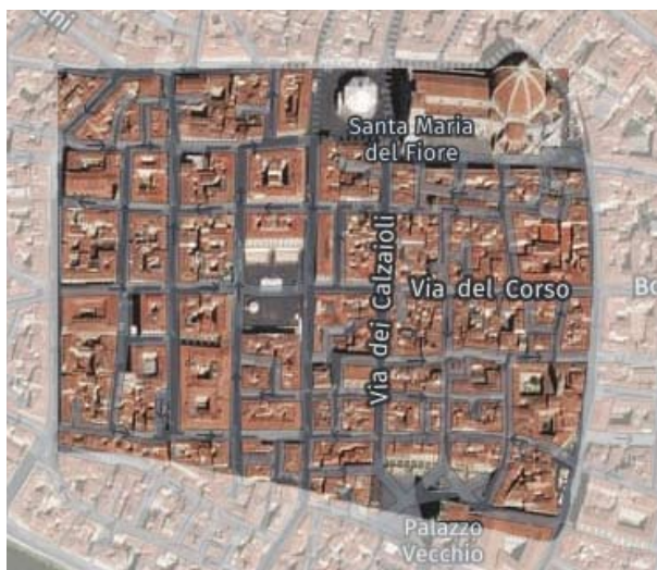
Figura 3: Veduta aerea di Firenze con evidenziata l'area occupata dalla colonia romana di Florentia

La crescente utilità della piana fiorentina per il transito, sottolineata prima dal passaggio della via Cassia etrusca sostituita poi dalla via Cassia romana, determinò tra il 30 e il 15. a.C. la creazione della colonia romana di Florentia . Dall'abitato quadrangolare difeso da una cinta muraria in mattoni e orientato esattamente sui poli cardinali, Florentia aveva un reticolo viario a croce con centro l'inizio di via degli Speziali da piazza della Repubblica (punto oggi contraddistinto dalla Colonna dell'Abbondanza), da dove l'asse stradale da nord a sud – il cardo – passava per le attuali via Roma e Calimala, mentre quello est-ovest – il decumanus – seguiva le attuali via del Corso, via degli Speziali e via Strozzi. La cinta muraria in mattoni con torri circolari è ancora leggibile nella pianta del centro storico (figura 3).