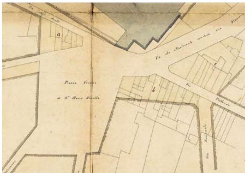
Figura 21: Indicazione dei fabbricati da demolire. ASCFi, Fondo disegni, Pianta di generale riordinamento delle piazze e vie attorno la stazione delle Ferrovie Livornesi, 1861, amfce 1613 (cass. 53, ins. E), particolare.

più fragili, quali i dipinti parietali, nascosti dietro strati di tinta, le finiture degli intonaci, i pavimenti. L'adattamento a nuove funzioni conduce inoltre a tamponature e tramezzature che alterano volumi e aperture antiche.