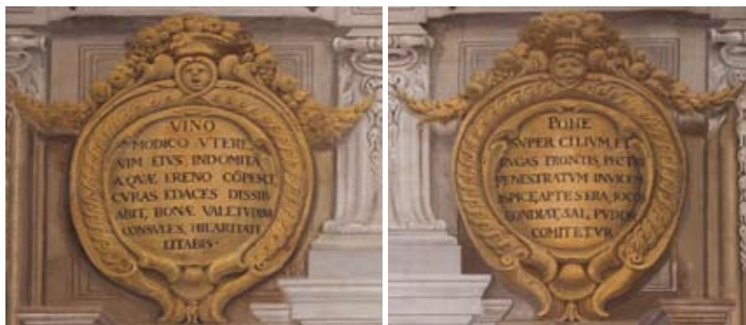
Figure 35-36: Dettagli degli scudi ovali presenti nella parete di fondo

Al di sotto si trova il cartiglio con il nome del committente e la data 1650. Ai lati dello stemma Cerretani sono dipinti due scudi ovali di colore oro sormontati da cornucopie di frutta, festoni e una maschera grottesca. All'interno dei due scudi ovali si leggono iscrizioni in latino che invitano, a sinistra, a fare uso moderato del vino in modo da assicurarsi buona salute e felicità, a destra, ad abbandonare il cipiglio della fronte per disporre l'animo al piacere di una conversazione allegra e intelligente (figure 35, 36).