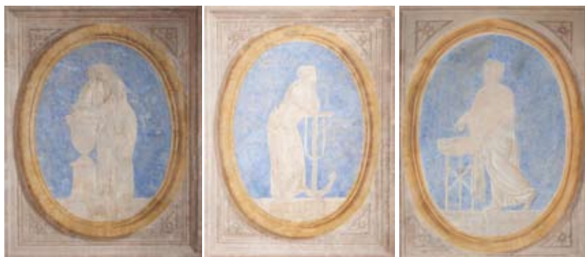
Figura 25-26-27: Medaglioni ovali su fondo azzurro raffiguranti figure femminili in diversi atteggiamenti

Anche a causa dello stato di conservazione che ne compromette la lettura, non è chiaro invece il significato dei medaglioni sulla parete a confine con la stanza di accoglienza della biblioteca. Qui sono raffigurati una donna con una lira o un'arpa accanto a quella che sembra una colonna spezzata – simbolo di interruzione della vita – su cui si potrebbe anche intravedere un albero sradicato, emblema araldico dei Cerretani. Se così fosse questo medaglione potrebbe rappresentare le preghiere a Dio per la casata estinta o le lodi umane per essa. L'altro medaglione presenta una donna accanto a un tripode che sembra sorreggere un bacile; la simbologia di questa immagine ancora sfugge (figura 27).