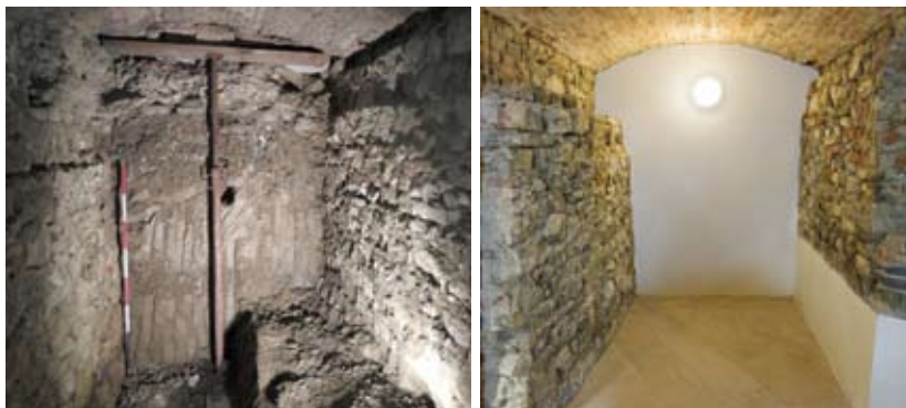
Figure 10-11: Nella prima immagine lo scavo dello spazio tra l'edificio rasato al suolo in età medievale (a sinistra) e la costruzione realizzata subito dopo la demolizione (a destra). Nella seconda immagine, l'interno attuale dell'edificio

Le demolizioni. Dopo un ridotto lasso di tempo, mentre la turris resta in funzione, le strutture a nord e a est di essa vengono totalmente rase al suolo, a un livello su cui viene impostata una estesa pavimentazione a cielo aperto in ampie lastre di arenaria: i reperti ceramici ritrovati consentono di datare l'operazione entro la prima metà del Trecento. Alla demolizione delle precedenti strutture corrisponde la costruzione di un nuovo edificio, circa 10 metri a oriente della turris e 2,5 metri più a est di quello appena distrutto (figure 10, 11). In conseguenza a questa ristrutturazione dell'area, lo spazio lastricato formava un ampio cortile largo circa 10 metri, compreso tra questa nuova struttura e la preesistente turris ancora in opera.