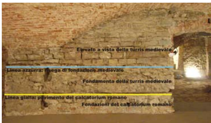
Figura 4: La parete della sala interrata attualmente visitabile con evidenziati i diversi livelli, dal calcatorium romano alla turris medievale

La villa romana. Nell'assetto romano di Florentia , l'area di Palazzo Cerretani si trovava esattamente al centro della prima centuria a nord-ovest della città. Le indagini archeologiche hanno dimostrato che nell'area del palazzo sorgeva sino dalla fondazione di Florentia una villa , edificio in parte abitativo e in parte destinato ad attività produttive, come documentano vari frammenti di ceramica da tavola di produzione aretina risalenti al periodo tra la fine del I secolo a.C. e gli inizi del I secolo d.C.. All'epoca romana risalgono sicuramente i resti di due strutture connesse tra loro, sottostanti la zona centrorientale del palazzo e che rappresentano quanto rimane in situ di un impianto di spremitura vinaria. Parti del pavimento della sala destinata a vasca di spremitura, il calcatorium , si sono conservate fino ad oggi perché vennero inglobate in epoca medievale dalla costruzione delle fondamenta di una turris (torre), a loro volta poi trasformate nella parete dello scantinato oggi visitabile (figura 4).